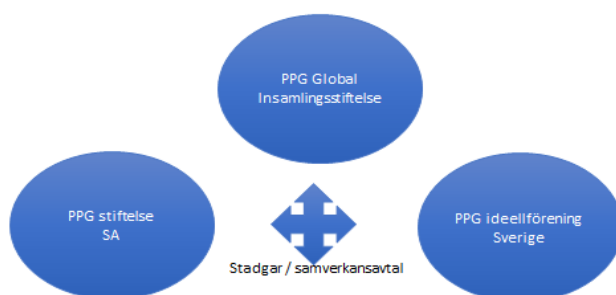
PPG legal struktur

Den legala strukturen utformas i de stadgar och licensavtal som PPG och PPG:s olika verksamhetsområden gemensamt förbinder sig till.